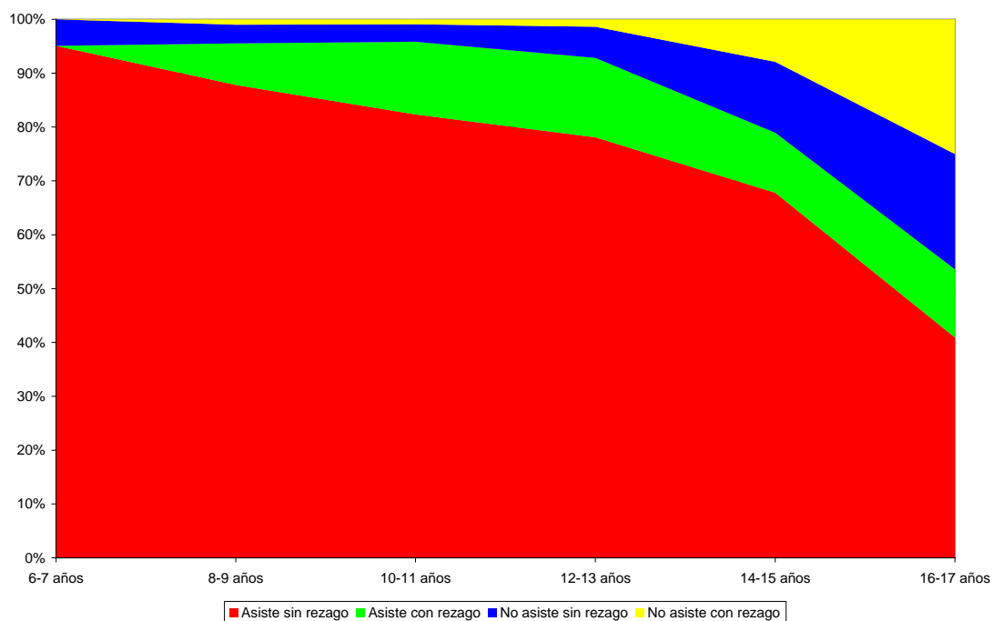
Gráfica 3. Desempeño escolar de la población menor inmigrante por edad, México, 2010